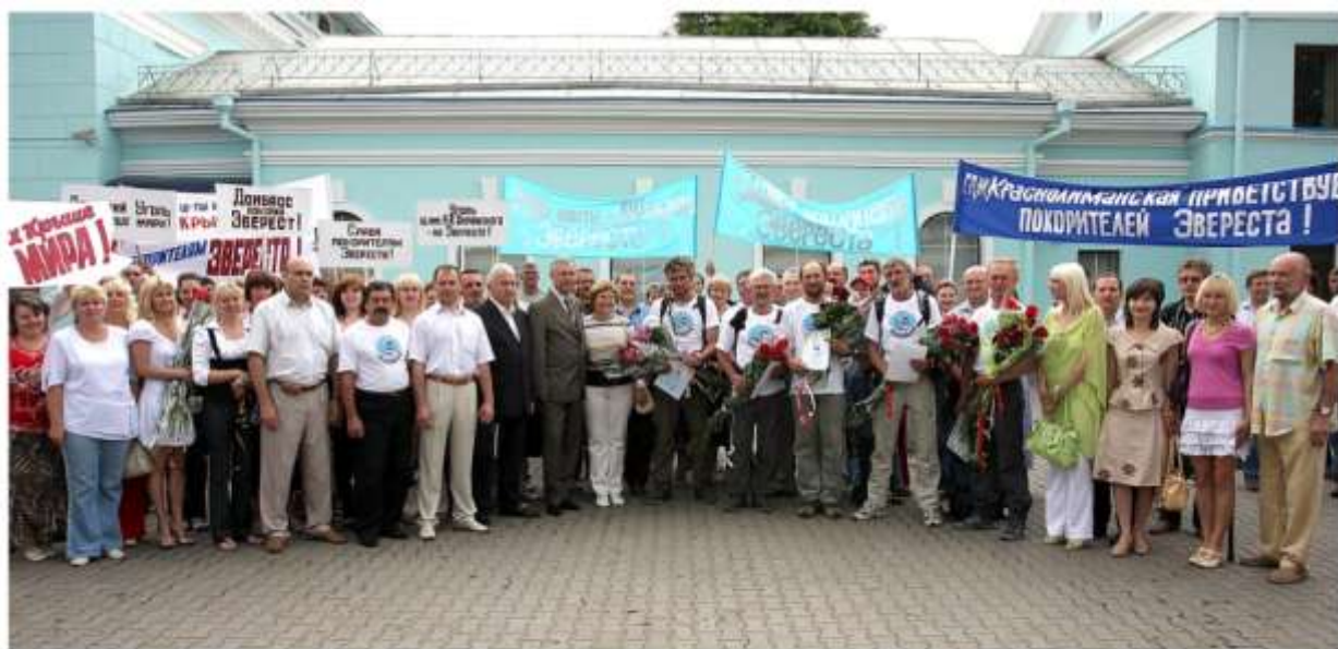
Встреча покорителей Эвереста на Донецком ж/д вокзале. 2008 г.