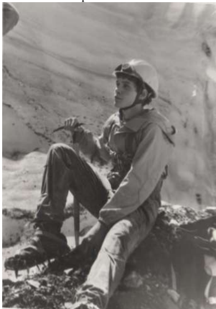
Первое восхождение. Кавказ, альпинистский лагерь. 1981 г.