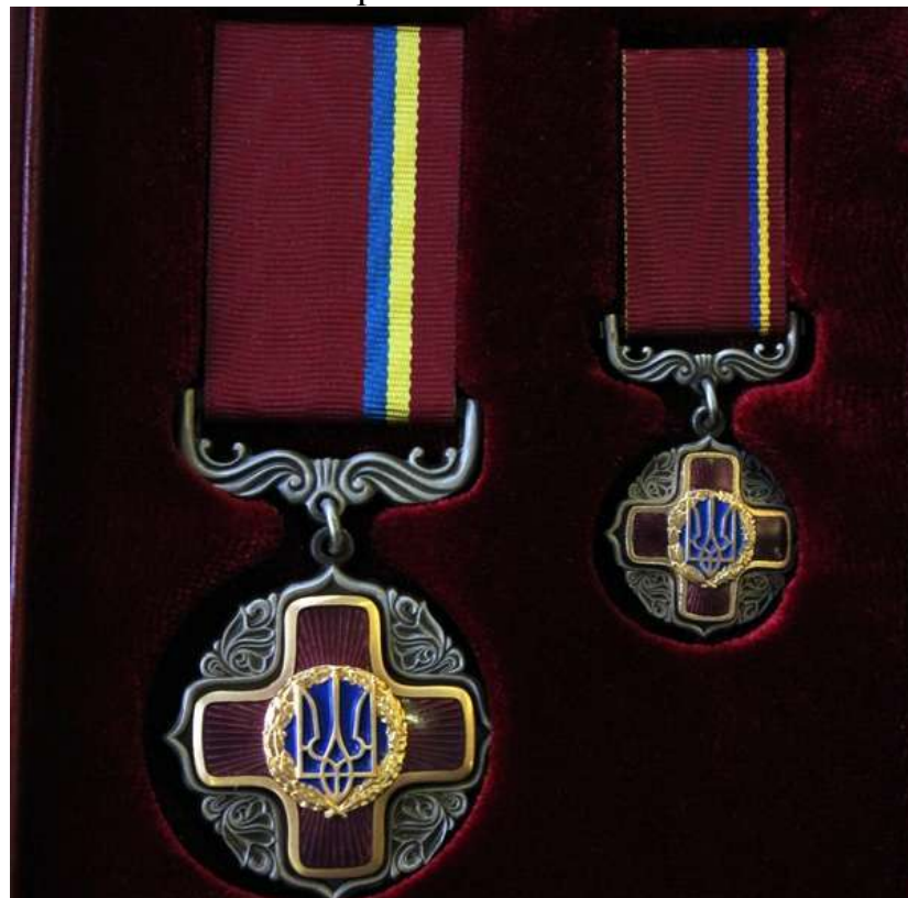
Орден «За заслуги»