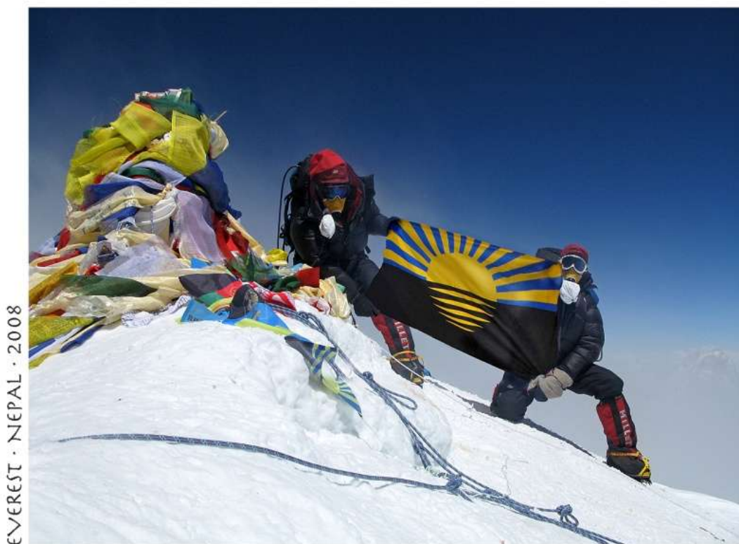
Первая Донецкая экспедиция на Эверест. Вершина Эвереста 2008 г.