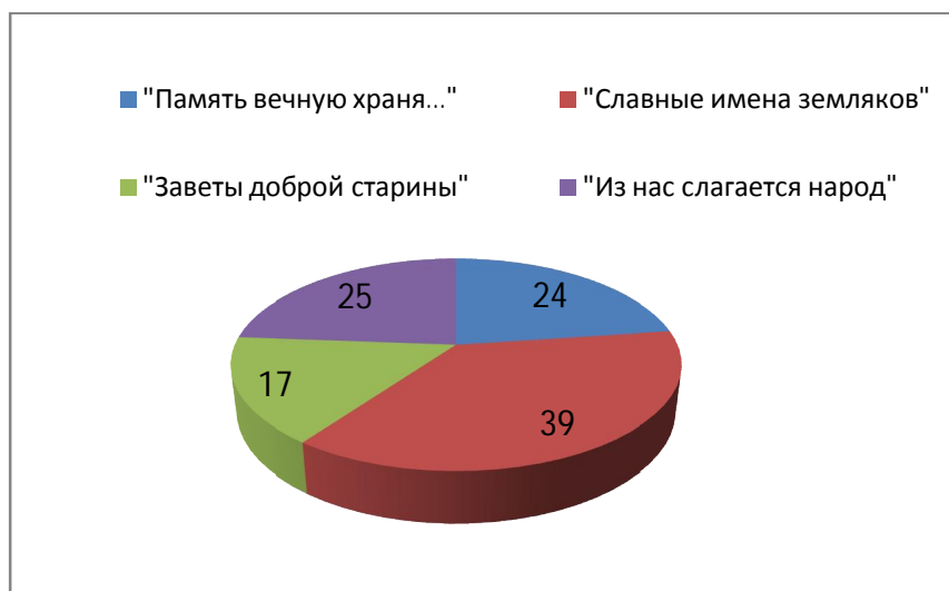
Диаграмма 3. Динамика участия в республиканском конкурсе поисково-краеведческих работ учащейся молодёжи «Донбасс – мой родной край» за 2015-2019 учебные года.