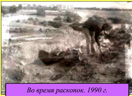
Во время раскопок. 1990 г.