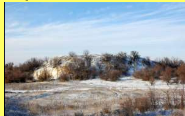
Общий вид кургана

Высота Беева кургана использовалась Дроздовским полком белогвардейской армии генерала Деникина как расположение одной из линейных гаубиц системы Шнейдера. Данное орудие активно использовалось для атак в направлении пгт. Скотоватой и прикрытия отхода при наступлении красногвардейцев из г. Горловки.