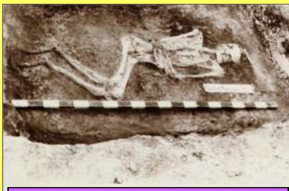
Захоронение вождя. Раскопки 1990 г.