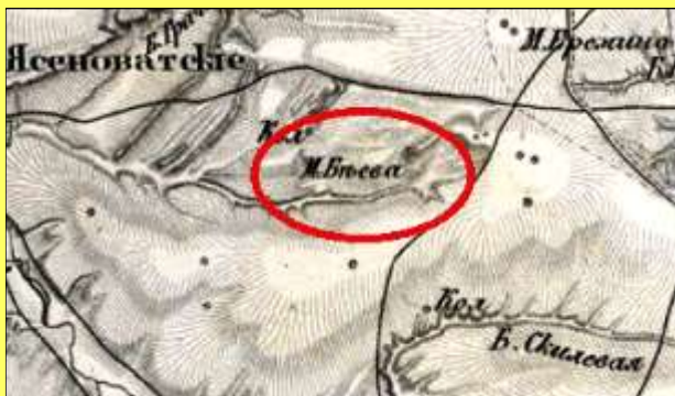
Беева Могила на старой карте. 1861 г.