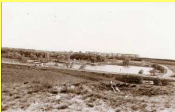
Вид на Пантелеймоновку с Беевого кургана