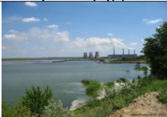
Вид Старобешевской ТЭС с водохранилища