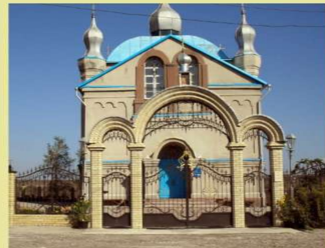
Храм Свято-Владимирской Божьей Матери.

Ильинская церковь была построена в 1874 году. Церковь имела несколько гектаров земли и два дома для проживания священника и псаломщика.