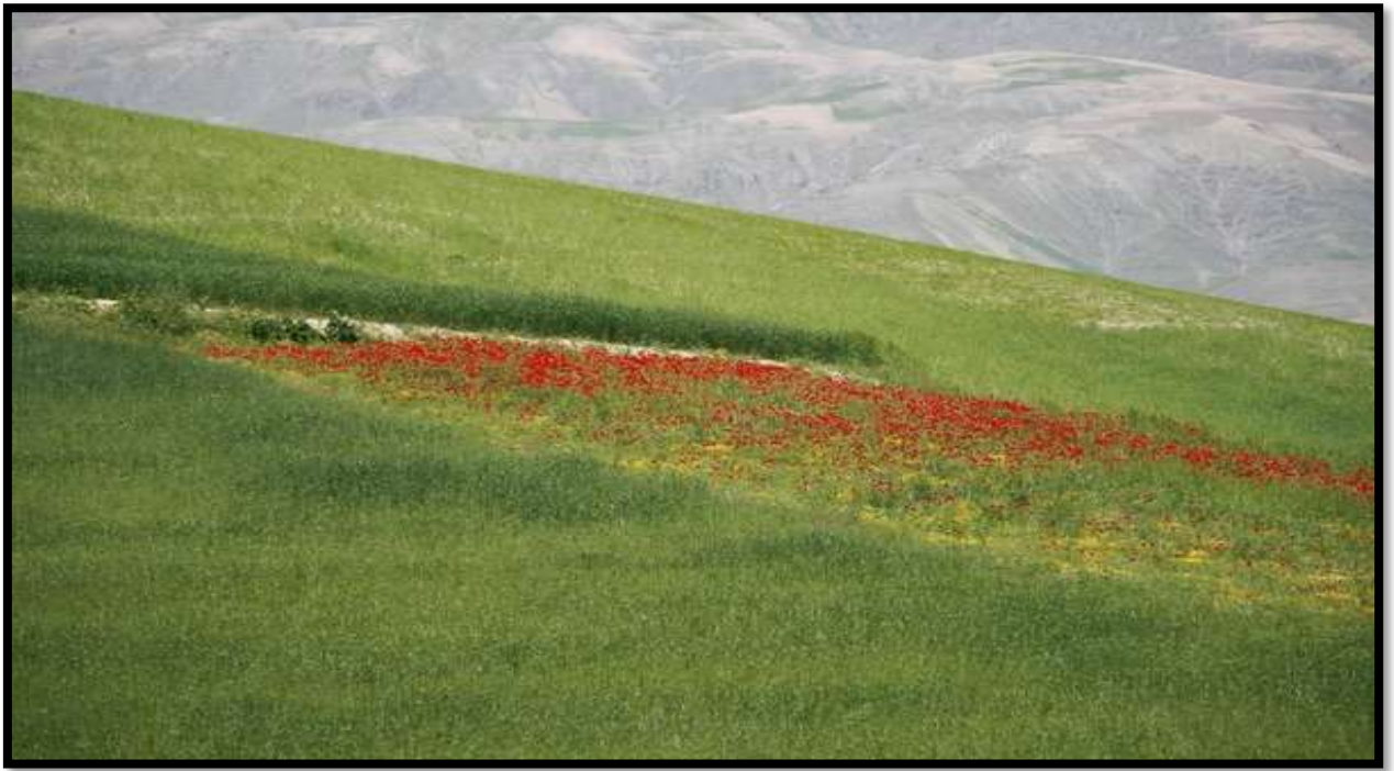
Маки на месте гибели Хадеева Фирдинанта