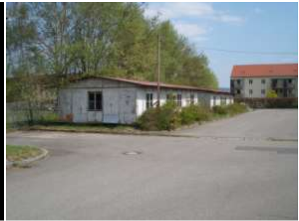
Барак шталага XIIIb в Вайдене