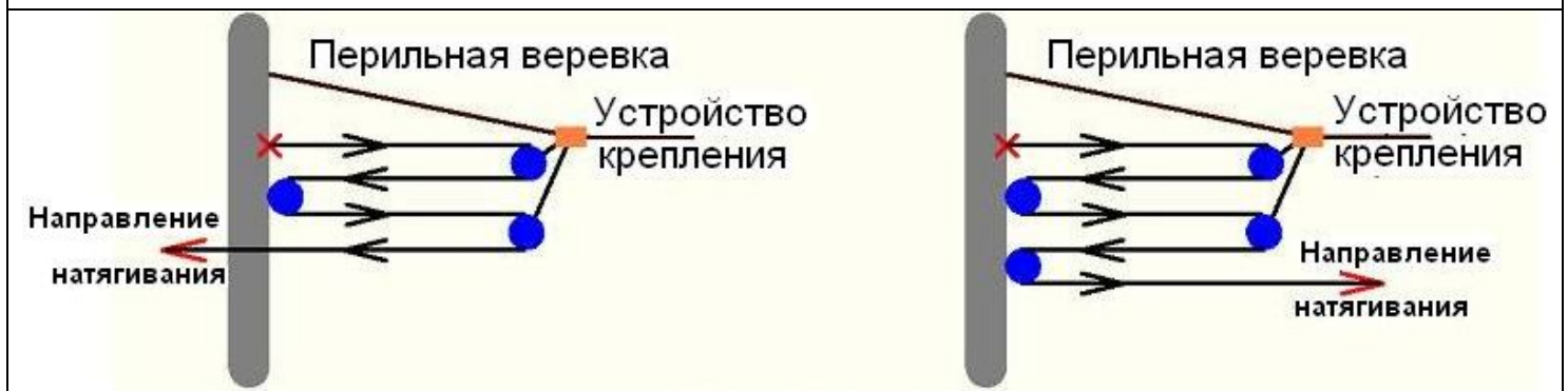
«Двойной полиспаст» (4:1)