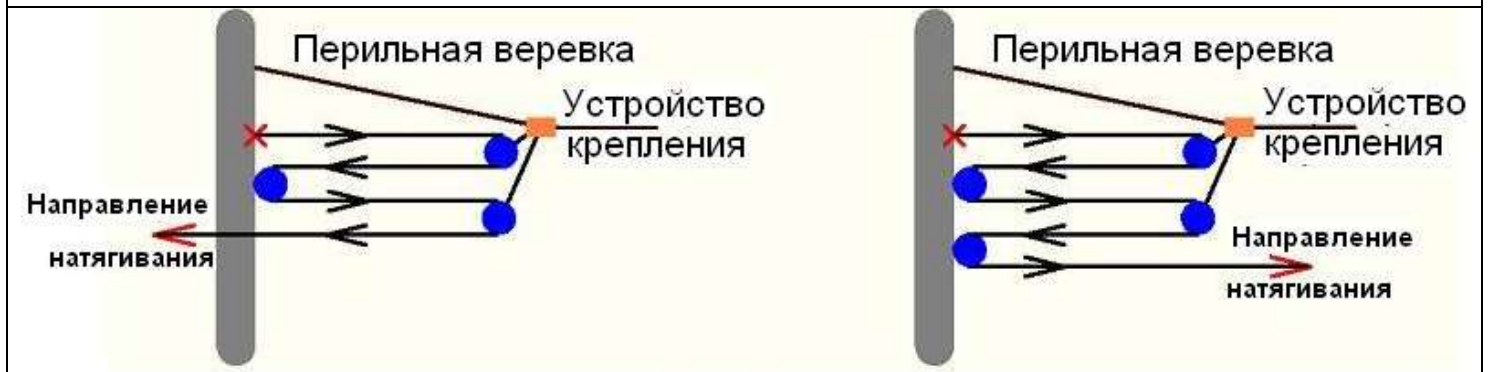
«Двойной полиспаст» (4:1)