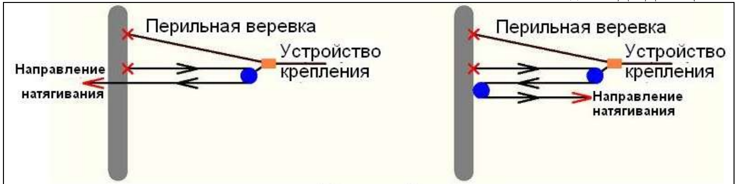
«Одинарный полиспаст» (2:1)