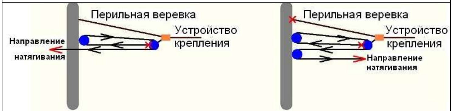
«Полуторный полиспаст» (3:1)